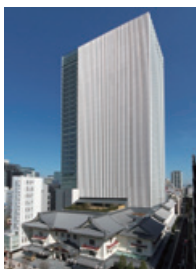
「歌舞伎座タワー」 ©松竹株式会社・株式会社歌舞伎座

【権利ビジネス・その他】2次元アイドルキャラクターと文通ができる世界初の総合アイドルプロジェクト「フロムアイドル」の配信を開始して好評を博しており、当社発のアイドルキャラクターとして今後様々なメディアへ展開して参ります。