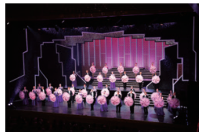
2021年6月 大阪松竹座 「レビュー夏のおどり」

【配信】6月に信州・まつもと大歌舞伎2021「夏祭浪花鑑」は生配信を行い、好評を博しました。また、歌舞伎座の最新舞台、過去の名作等を「歌舞伎オンデマンド」で定期的に配信し、毎月配信した「紀尾井町家話」等のオンライントークショーが高稼働となりました。