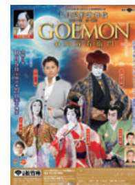
2021年10月 大阪松竹座 「GOEMON 石川五右衛門」 ©松竹株式会社