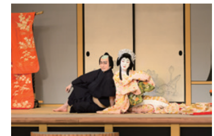
2021年4月 歌舞伎座 「桜姫東文章 上の巻」