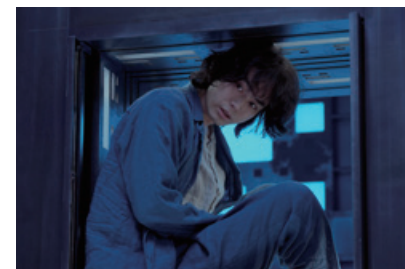
「CUBE 一度入ったら、最後」