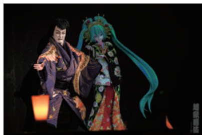
超歌舞伎「御伽草紙戀姿絵」