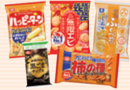
1,000円相当の詰め合わせ