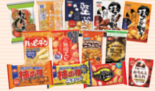
3,000円相当の詰め合わせ